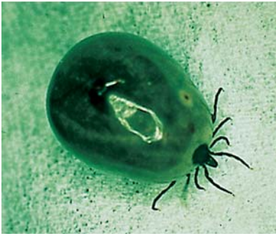
FEMELLE GORGÉE D'IXODES RICINUS : VECTEUR ET RÉSERVOIR