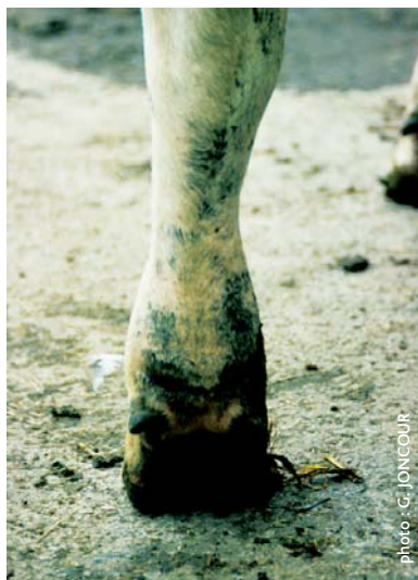
UN SYMPTÔME CARACTÉRISTIQUE DE L'EHRlichiose : L'ŒDÈME DES PATURONS

Note : (*) dépend de l'expérience : **J0 = Jour de la visite ou du constat par l'éleveur / *** tiques et ectoparasites hématophages